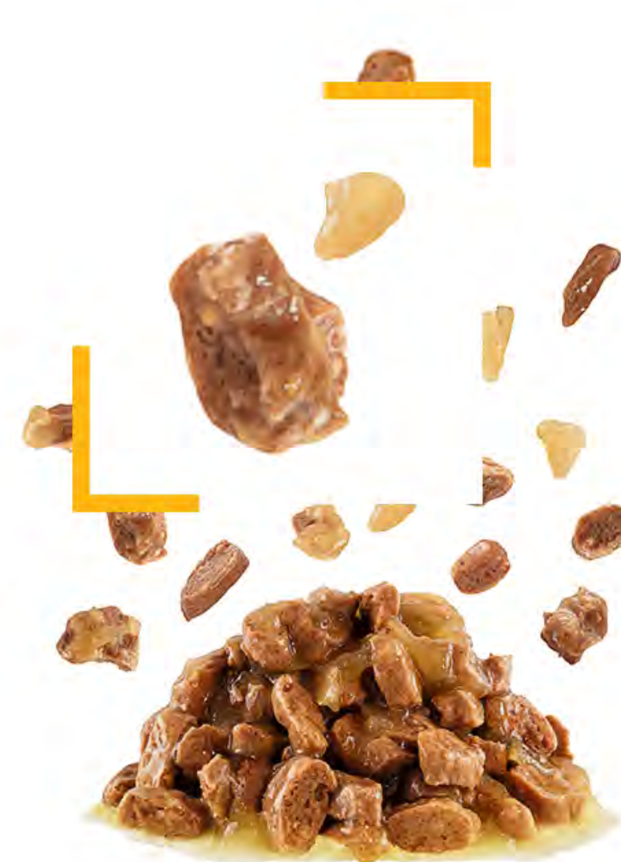
KOUSKY V ŽELÉ