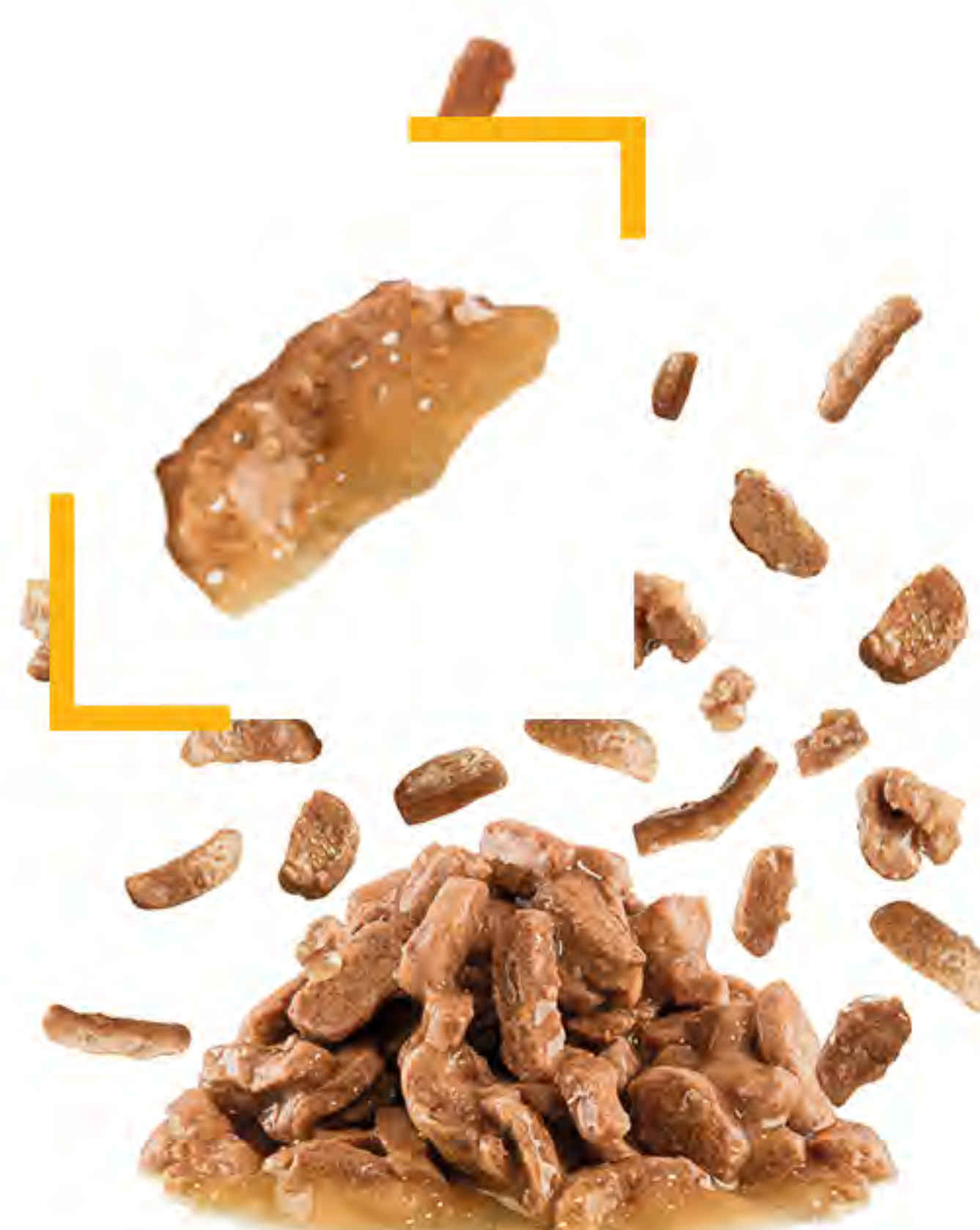
KOUSKY VE ŠTÁVĚ

...která je krémovější, jemnější a lépe pokrývá kousky krmiva. Složení krmiva má specifické masovité chutě, jež stimulují kočičí smysly.